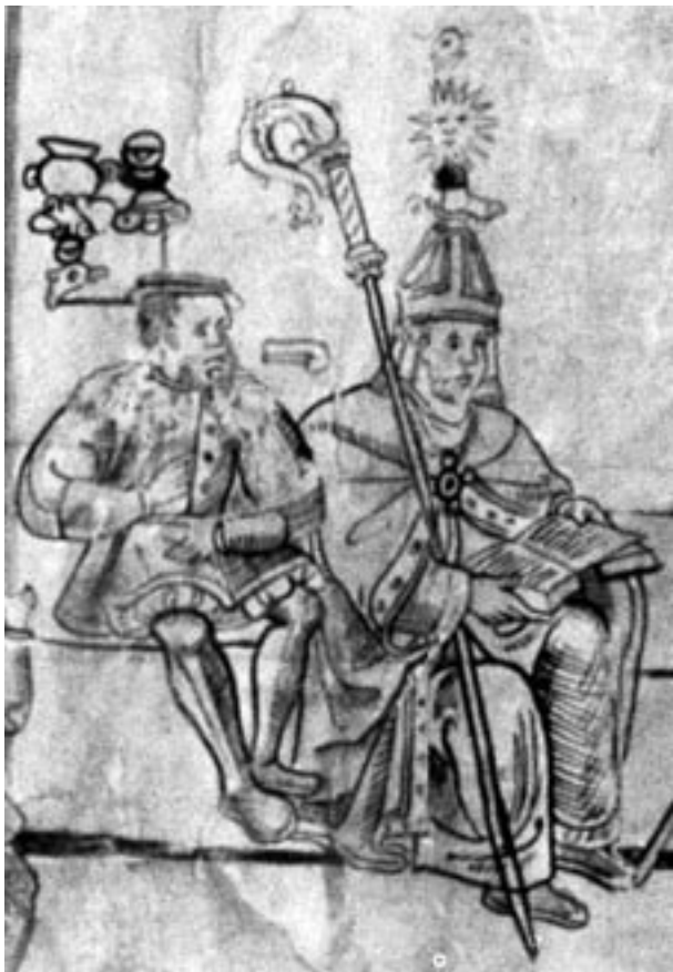
Fig. 2. El virrey don Luis de Velasco, Códice de Tlatelolco (1989).