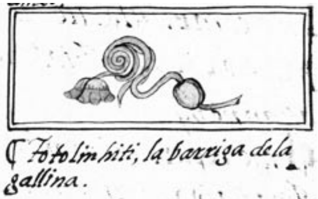
Fig. 4. Viñeta que ilustra los intestinos de un ave ( Códice Florentino , Lib. XI: 60r).