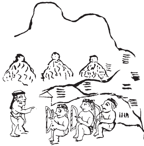
Figura 2. El señor tarasco Tariacuri da instrucciones a sus tres herederos de cómo constituir las tres capitales tras la derrota de sus enemigos. Frente a él escuchan su hijo Hiquíngare y sus sobrinos Tangáxoan e Hiripan. Relación de Michoacán , lám. 22.

Volvamos aquí a la mencionada diferencia entre téucyotl y tlahtocáyotl . Puede suponerse que la institución de la triple alianza tuvo como una de sus muy remotas causas la necesidad de armonizar intereses económicos de múltiples poblaciones heterogéneas. Como se dijo, en Mesoamérica se observan dos fundamentos muy diferentes de las relaciones de subordinación política: el primero, de orden gentilicio, al que puede denominarse “de sangre”, se basa en el supuesto parentesco de todos los componentes de un conglomerado por descender de un antepasado común de carácter mítico. Los gobernantes ocuparían el sitio de los “hermanos mayores”, y regirían con la autoridad de su linaje, llegando al punto de estar muy próximos al personaje divino ancestral. Se mandaba a todos los “parientes”, independientemente del lugar que habitaran. El otro sistema, que puede llamarse “territorial”, se basaba en el control del territorio, y el gobernante asumiría el papel de encargado divino de su distribución y administración. El poder se ejercería sobre todo aquel que ocupara dicho territorio, independientemente de su identidad de supuesta ascendencia, incluyendo la étnica. El sistema territorial era más desarrollado y complejo que el gentilicio; pero no lo había desplazado, sino que lo había incor-